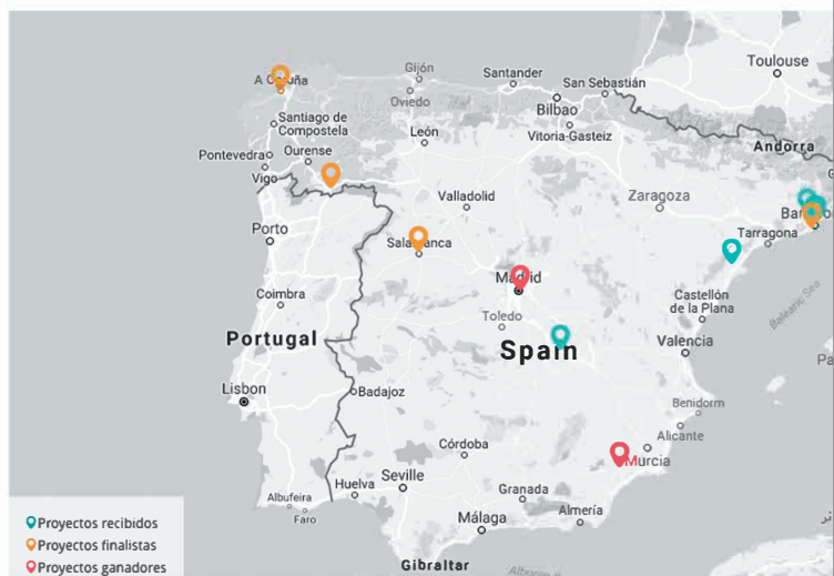
Mapa de proyectos de bibliotecas públicas para la inclusión social. 2016.