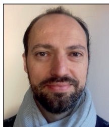
Felipe Munita ✉

Artículo recibido el 05-02-2019 Aceptación definitiva: 22-05-2019