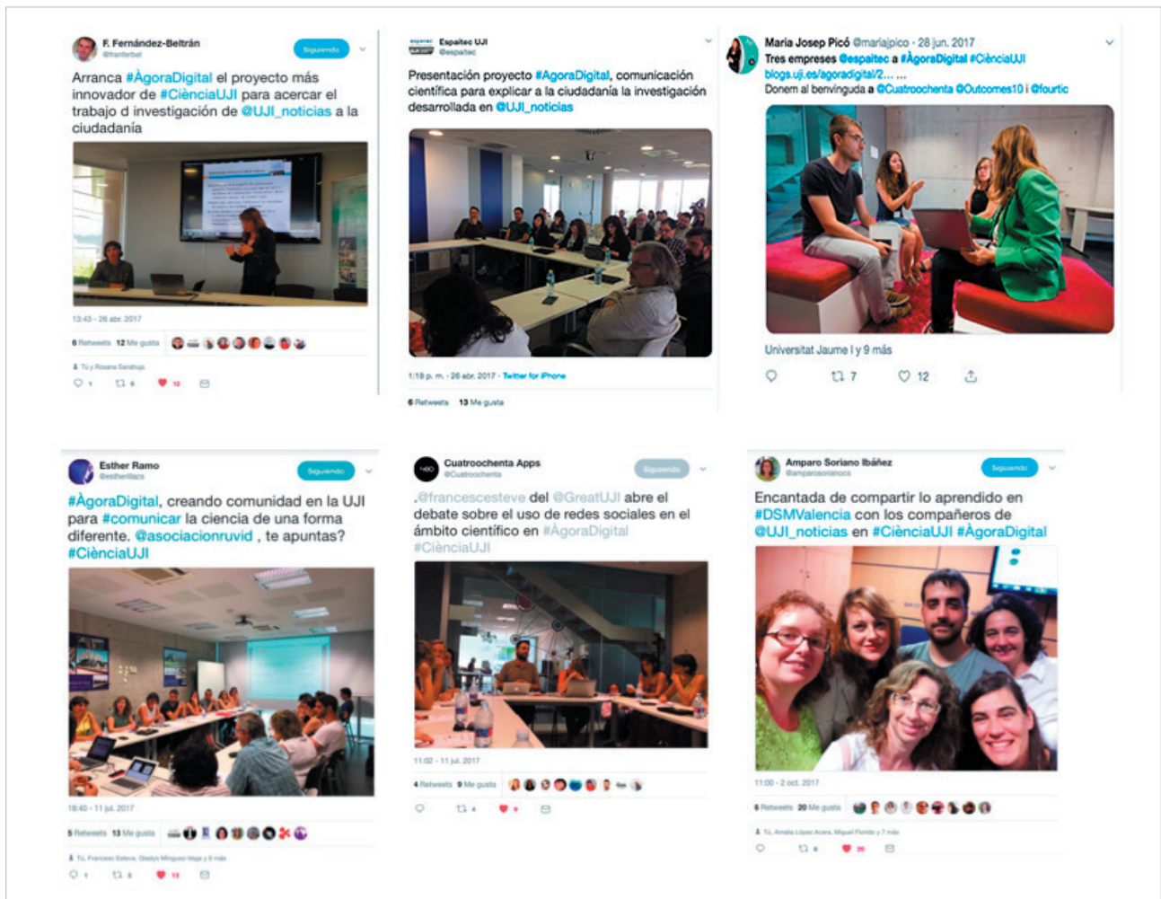
Figura 1. Tweets de la organización de Grupos de interés y sesiones formativas del proyecto Ágora Digital

La estrategia transmedia implementada ha tenido en cuenta la necesidad de llevar a cabo acciones online y presenciales. Como acciones online se optó por el blog Ágora Digital y por Twitter con los mensajes publicados con la etiqueta #ÁgoraDigital. Con respecto a la elección de las redes sociales hubo debate porque Facebook era la red social más utili-