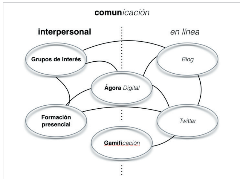
Figura 2. Esquema de las acciones desarrolladas dentro del proyecto Ágora Digital y de la conexión existente entre ellas.

La iniciativa Ágora Digital ha logrado la implicación formal de miembros de diez grupos de investigación y dos institutos de investigación y el Parque Científico, Tecnológico y Empresarial, EspaiTec , y tres de las empresas radicadas en este espacio. Además, durante su desarrollo también ha facilitado la implicación individual de investigadores de otros grupos y departamentos de la Universidad . A su vez, se ha consolidado como un espacio de interacción, conocimiento y colaboración interdisciplinar de profesionales de las diversas áreas de conocimiento, como revela la creación del Seminario Permanente de Investigadores en Cambio Climático y también como un área de formación para la comunicación científica y la conformación de la identidad digital de la comunidad investigadora.