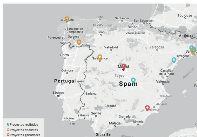
Mapa de proyectos de bibliotecas públicas para la inclusión social. 2016.