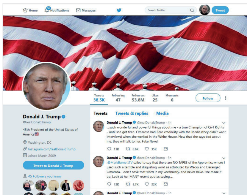
Cuenta del presidente de los EUA Donald J. Trump en Twitter https://twitter.com/realDonaldTrump

El objetivo de este artículo es analizar el tratamiento que el presidente de Estados Unidos, Donald Trump, da a los