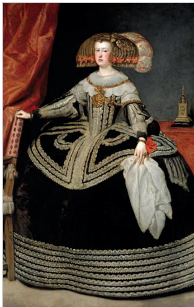
Figura 3. La reina Mariana de Austria , de Diego Velázquez, que procedente del Museo del Prado y tras ser evacuada hasta Ginebra en 1939, hoy se encuentra en el Museo del Louvre por una entrega realizada por el Gobierno de Franco al de Vichy en 1941

El segundo objetivo es desvelar qué obras están en paradero desconocido o ubicadas en un lugar diferente del que fueron incautadas y después depositadas. Gracias, por