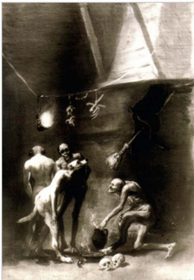
Figura 1. La cocina de las brujas de Francisco de Goya, hoy en paradero desconocido

se inicia un proceso de búsqueda colaborativa. Un caso muy ilustrativo puede ser el de La cocina de las brujas de Goya que se encontraba en la embajada de la España republicana en Ciudad de México cuando ésta fue clausurada y de la que se desconoce su paradero actual.