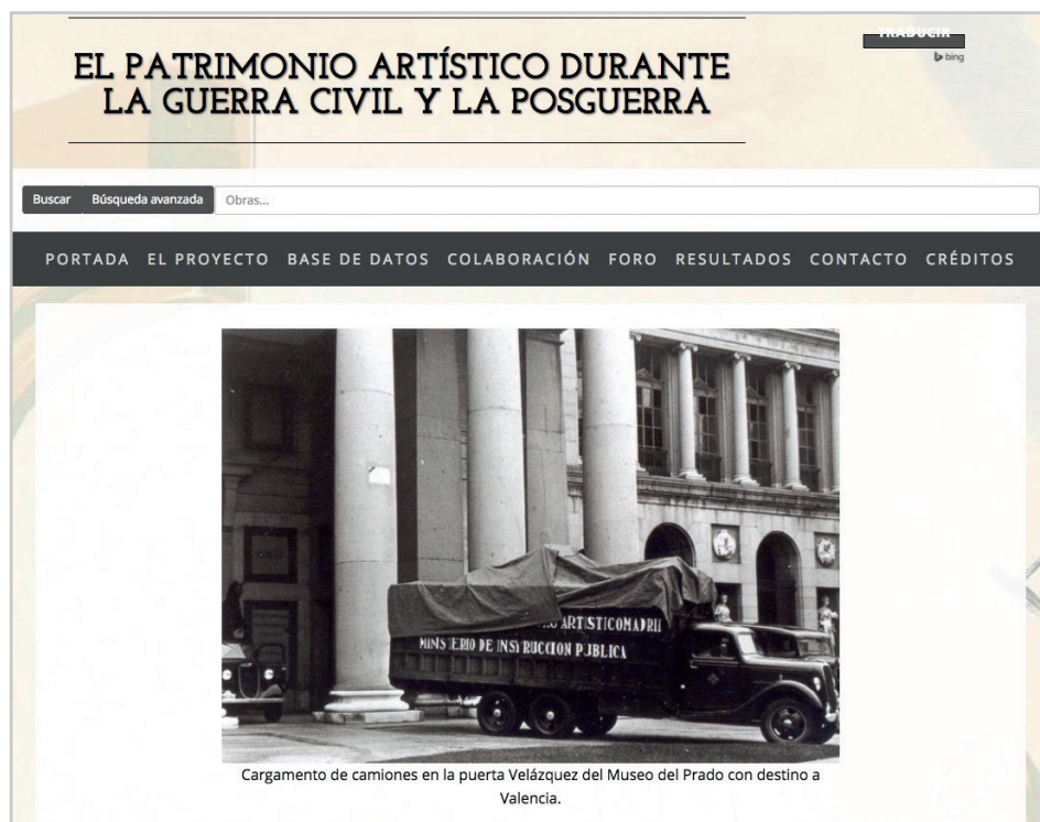
Figura 2. Web del proyecto http://pgp.ccinf.es/PGP/#