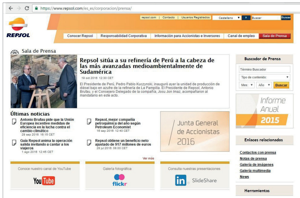
Figura 1. Ejemplo de doble buscador en una sala de prensa virtual: general y específico de prensa. Repsol (octubre de 2016).

A continuación se sitúan las opciones de búsqueda general