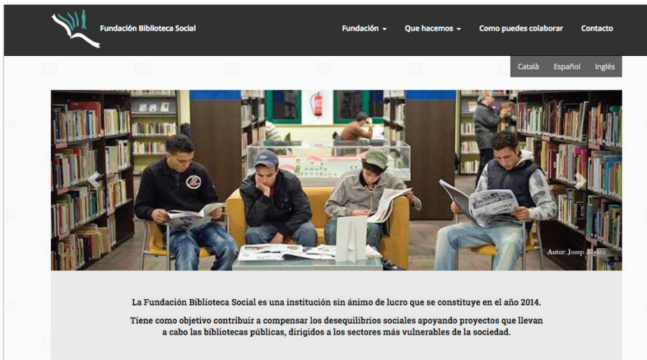
Fundación Biblioteca Social http://fundacionbibliotecasocial.org/es

biblioteca, sino para dar apoyo al equipo profesional, dotándoles de pautas y estrategias de actuación a la hora de afrontar estos proyectos y tratar con diferentes colectivos.