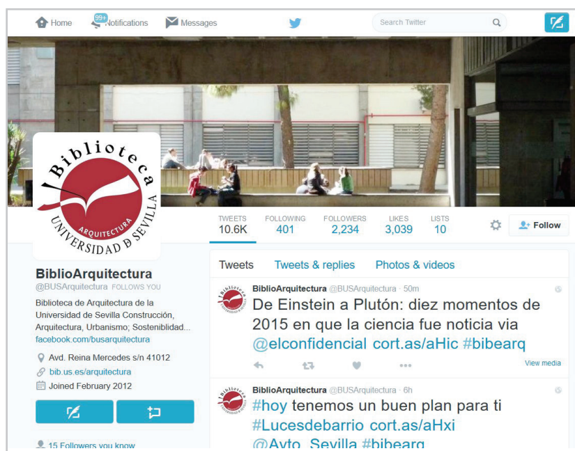
Figura 3. Biblioteca de Arquitectura de la US en Twitter https://twitter.com/busarquitectura

Las listas de distribución de correo electrónico (de alumnos de nuevo ingreso, de grado, de master, de doctorado, profesores, etc.) son un canal muy útil con los profesores, bastante menos con los alumnos de master y menos aún con los de grado. Para optimizar la eficacia de este canal es importante no enviar correos constantemente, utilizarlo sólo cuando hay que comunicar temas de interés.