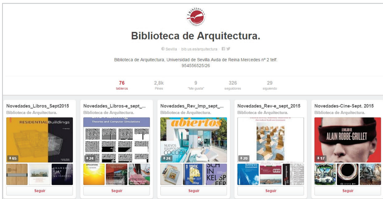
Figura 4. Tableros de Pinterest con las novedades del mes https://www.pinterest.com/bibarquitectura

Otros canales de comunicación como la publicación de noticias en la web de la Biblioteca y la Escuela , o la cartelería siguen teniendo su papel, más o menos importante dependiendo de la campaña.