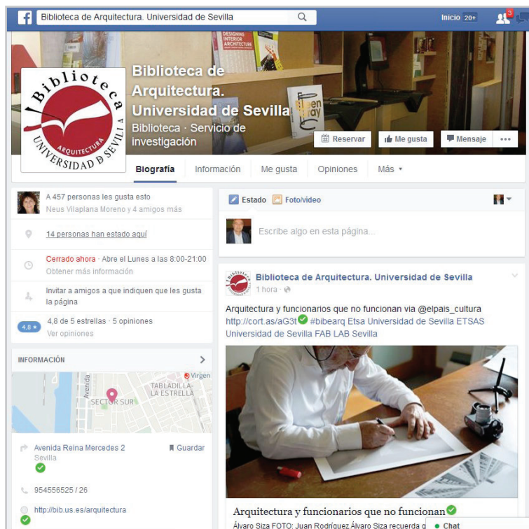
Figura 2. Biblioteca de Arquitectura de la US en Facebook https://www.facebook.com/busarquitectura

El contenido y los objetivos concretos de cada campaña de