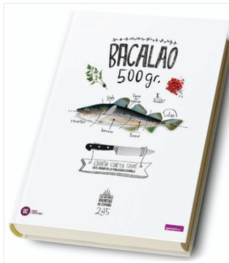
Portada del agencyBook: Las Mejores Agencias en España 2015.