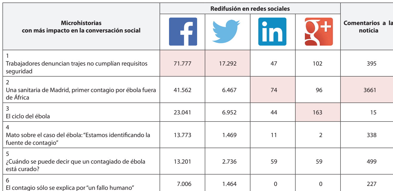
Tabla 3. Ranking de microhistorias que más han movilizadado a la audiencia online