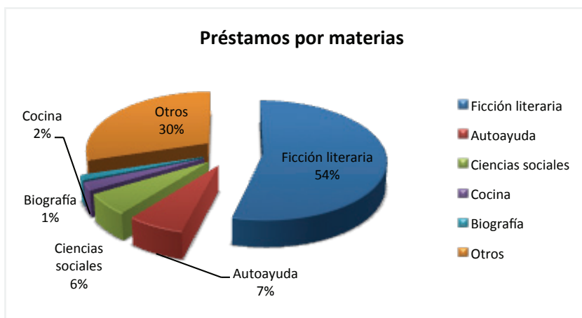
Gráfico 3. Porcentajes de préstamos por materia 12

futuro deben ofrecer servicios digitales sin olvidar la otra gran vertiente que las convierte en ágora, espacios acogedores y sociales.