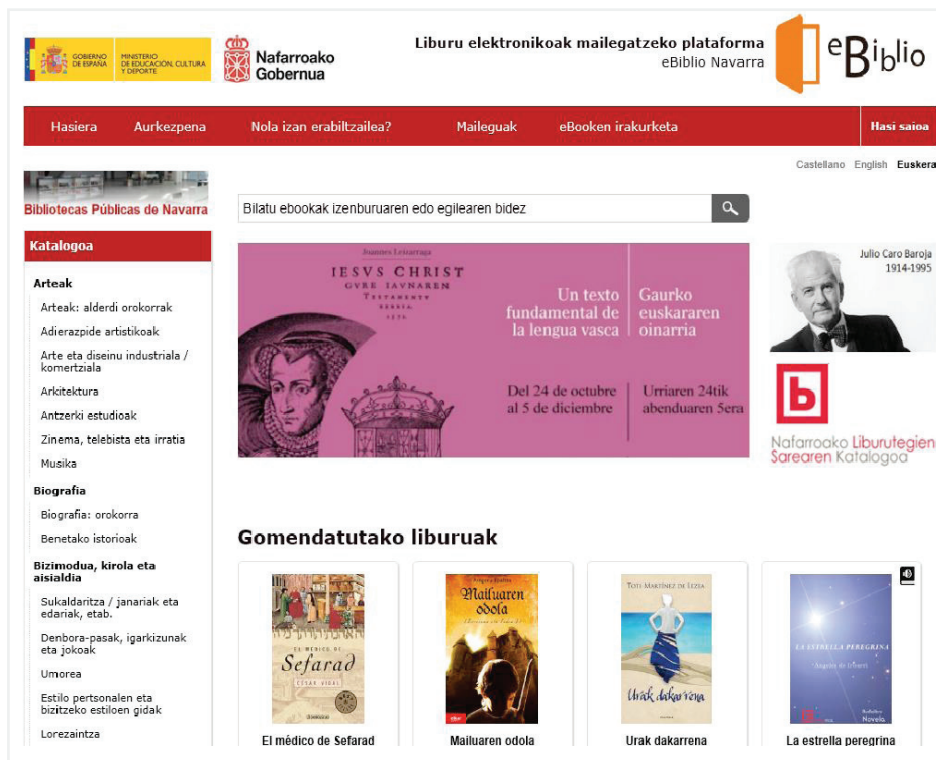
Figura 2. Home eBiblio Navarra en euskera http://navarra.ebiblio.es/?lang=eu

La plataforma se configura como un proyecto abierto, que las comunidades autónomas pueden incrementar y adaptar en función de sus propios intereses y particularidades. Las que así lo han decidido han incrementado la colección inicial adquirida por el Ministerio con la compra de licencias de otros títulos no incluidos en origen, bien en castellano, como es el caso de la Comunidad de Madrid, bien en otras lenguas oficiales del Estado, como en euskera en Navarra.