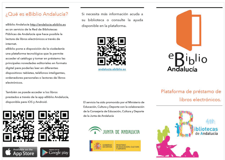
Figura 5. Folleto informativo eBiblio Andalucía http://www.juntadeandalucia.es/culturaydeporte/opencms/opencms/download/bihuelva/Triptico_eBiblio_Andalucia.pdf

También se ha difundido en las propias bibliotecas a través de cartelería, formación in situ , etc.