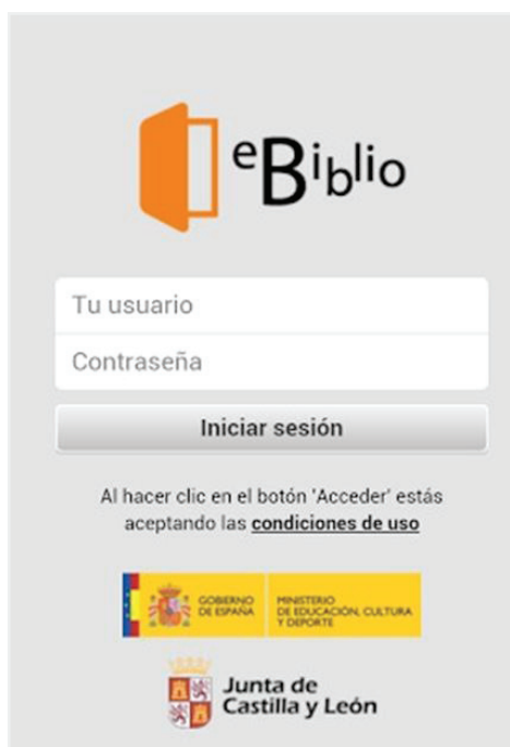
Figura 4. Aplicación gratuita eBiblio para lectura en la nube (ejemplo: Castilla y León)

El servicio de préstamo de libros electrónicos y audiolibros ya está disponible a través de la red de bibliotecas de las comunidades y ciudades autónomas indicadas en la tabla 4.