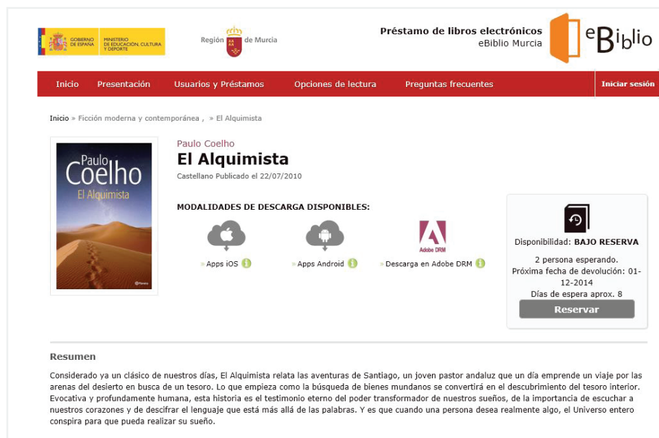
Figura 3. Ejemplo de título bajo reserva eBiblio Murcia http://murcia.ebiblio.es/el-alquimista-/9788408096375

Cada usuario dispone de una cuenta en la que puede realizar el seguimiento de sus libros prestados y reservas, así como la gestión de los dispositivos enlazados a la misma (con la opción de poder desenlazarlos). Desde la opción “Mis libros”, se puede anular la reserva.