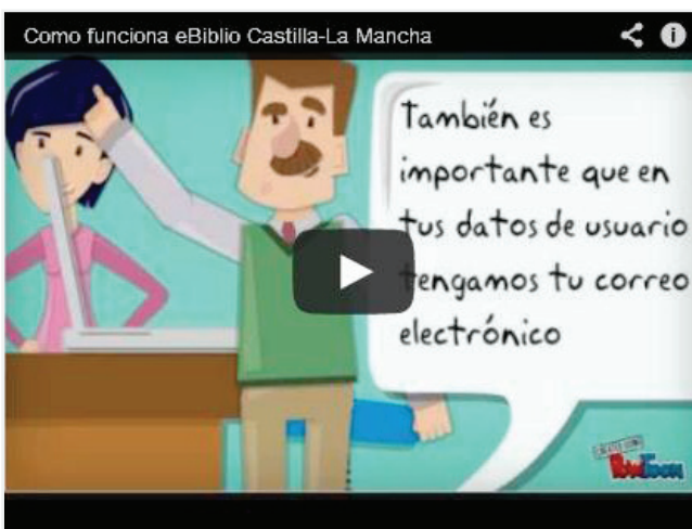
Figura 6. Vídeo tutorial red de bibliotecas de Castilla-La Mancha http://reddebibliotecas.jccm.es/portal/index.php/como-tomar-en-prestamo-libros-electronicos-y-audiolibros

Las comunidades y ciudades autónomas participantes en el proyecto también se han encargado de difundir el servicio en sus respectivas webs y elaborando folletos (figura 5) y vídeos tutoriales de presentación de eBiblio . Así lo han hecho comunidades como Andalucía, Cantabria, Castilla-La Mancha (figura 6), Castilla y León o Galicia.