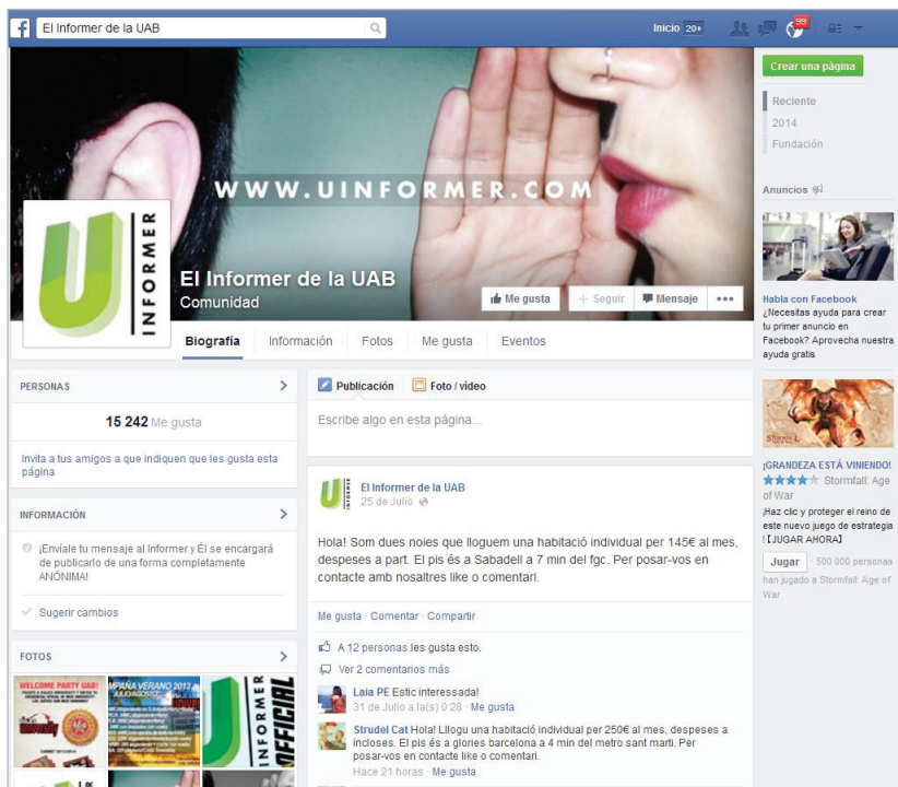
Figura 1. Informer de la Universitat Autònoma de Barcelona en Facebook https://www.facebook.com/pages/El-Informer-de-la-UAB/545689672109998

Dada la breve trayectoria del fenómeno será preciso estar atentos a posibles variaciones en el mismo en el corto y medio plazo, sin descartar tanto su extensión a otras redes (de hecho en Twitter ya comienza a proliferar también esta clase de iniciativas) como su pérdida de vigor y desaparición.