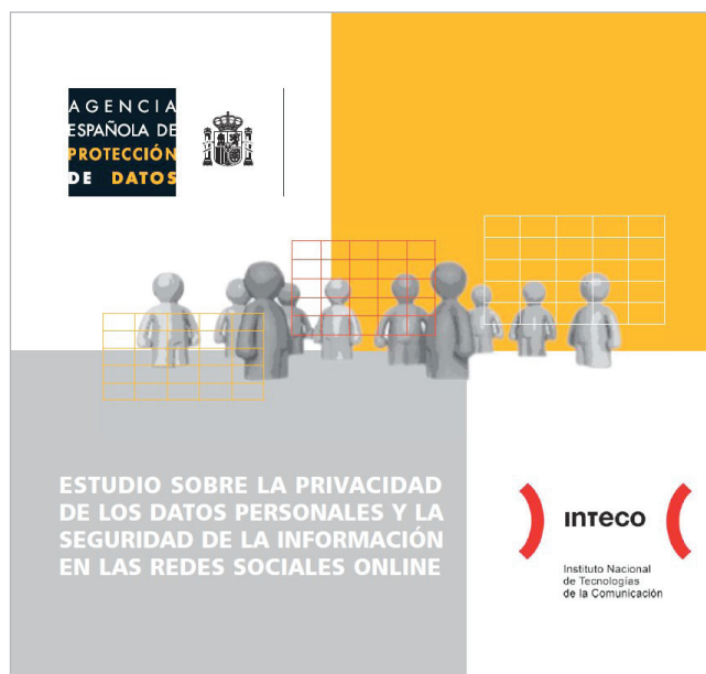
Figura 2. http://www.agpd.es

Aunque plantea que el autor tiene la posibilidad o no de limitar los usuarios que pueden ver determinados conte-