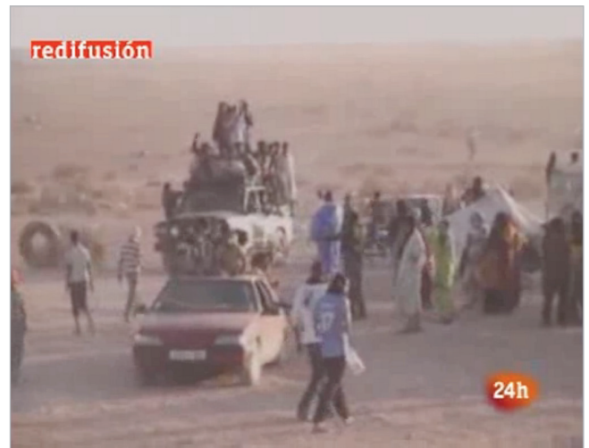
Figura 3. Imagen procedente de internet incluida en el reportaje “La intifada saharai” (13/11/2010) de Informe semanal http://www.rtve.es

En la reutilización de imágenes de archivo existe otra mala práctica habitual, más patente aún en las televisiones que trabajan en entorno digital, en las que los usuarios del archivo (redactores, realizadores, guionistas, etc.), equipados para su trabajo con nuevas herramientas, pueden recuperar documentos de archivo en modo “autoservicio” a través de las bases de datos, de manera que en muchos casos, suelen reutilizar las imágenes que ya conocen o las que encuen-