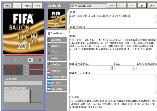
Figura 2. Ejemplo de metadatos de un clip de imágenes de deportes, tema cuyas condiciones de reutilización habitualmente son muy restrictivas (base de datos Invenio. Documentación PP II TVE )

En las televisiones se debería trabajar en lo posible con sistemas informáticos que impiden automáticamente la edición con imágenes de archivo sujetas a restricciones, y que gestionan la reutilización de imágenes de archivo en el trabajo diario de la producción, de manera que se evitaren algunas situaciones como, por ejemplo, la utilización abusiva de determinadas imágenes o la reutilización de las que ya han originado reclamaciones. Pero en ocasiones cuestiones económicas y/o técnicas no lo permiten.