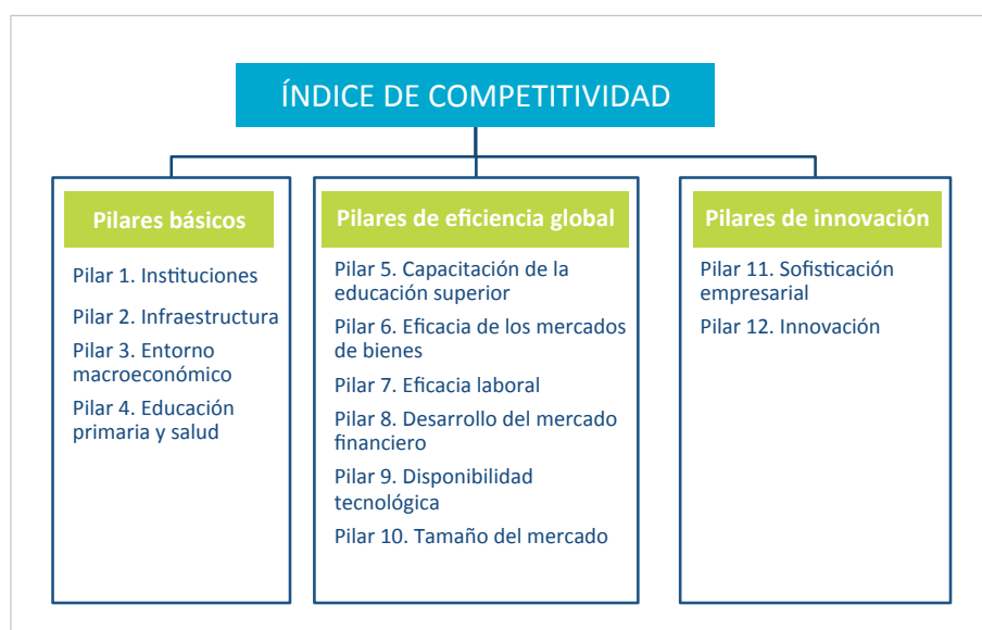
Gráfico 3. Índice de competitividad global (World Economic Forum, 2012)

El término recientemente acuñado de nueva economía o economía inmaterial , es decir, el desarrollo de toda la economía basada en la información y el conocimiento, y no en la producción de bienes industriales, está llamada a ser la gran especialización de los países desarrollados frente al resto