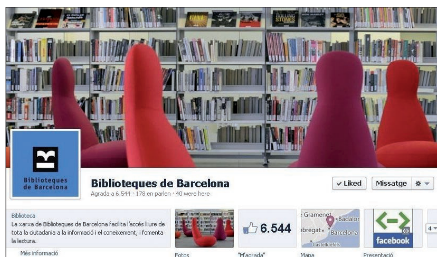
Figura 2. Página de Biblioteques de Barcelona en Facebook http://www.facebook.com/pages/Biblioteques-de-Barcelona/37085110804

A principios de 2009 Biblioteques de Barcelona creyó conveniente estar más presentes en las redes sociales y se creó una página en Facebook .