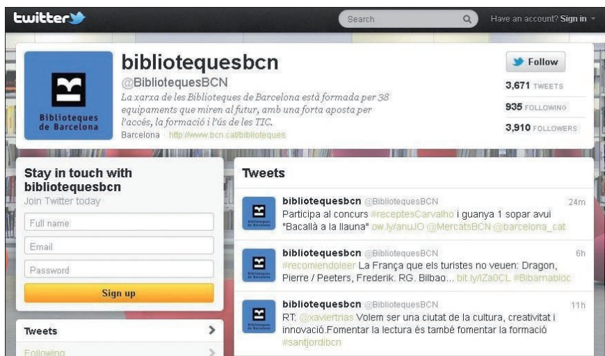
Figura 3. Twitter de Biblioteques de Barcelona , http://twitter.com/bibliotequesbcn

Pretendemos siempre ejercer una escucha activa de los seguidores, es decir, establecer un feedback para recibir sus comentarios, sugerencias, dudas y quejas con el propósito de intercambiar opiniones, compartir conocimiento, establecer puntos en común y evitar que nuestros tweets se conviertan en meros titulares. Una escucha activa que aúna el seguimiento y monitorización de los temas de interés en esta red de microblogging que monitorizamos con la aplicación Hootsuite .