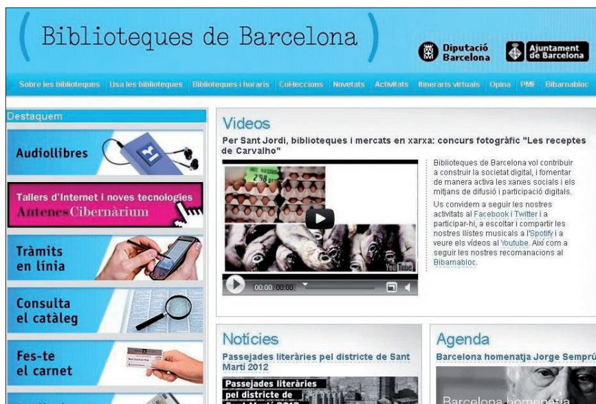
Figura 1: Web Biblioteques de Barcelona , http://www.bcn.cat/biblioteques

La web incorporó formatos multimedia (vídeos y videotutoriales), guías de lectura y la sindicación a las agendas y noticias con la posibilidad, además, de compartir estas informaciones en las redes sociales. También intentaba resolver las principales dudas de los usuarios con un apartado de preguntas frecuentes, tanto en la web general como en los portales específicos, así como con un apartado de opinión donde los usuarios pueden realizar sugerencias, quejas, agradecimientos y propuestas de compra de materiales. También se mejoró la accesibilidad.