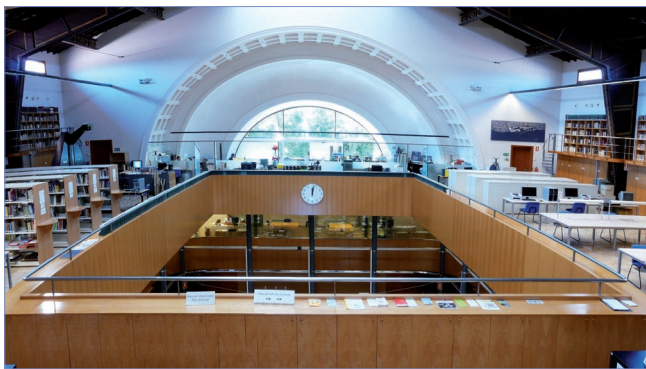
Sala de la Cartoteca, Institut Cartogràfic de Catalunya

Se empezaron a servir a los usuarios de la Cartoteca las primeras impresiones en formato 1:1 y las primeras copias digitales de los materiales.