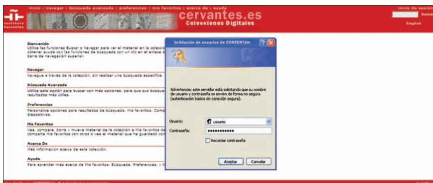
Pantalla de validación en el directorio activo del Instituto Cervantes

El software adquirido para la difusión en internet de las colecciones digitales según los estándares actuales de intercambio de información, ContentDm , permite recopilar, organizar y dar acceso web a los documentos digitales.