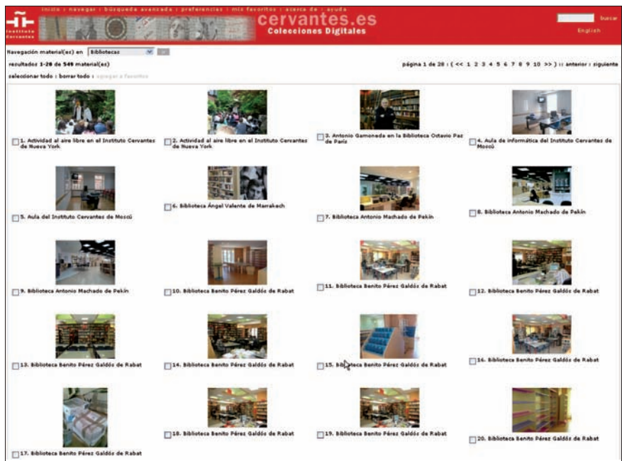
Navegación en la colección

Se ha presentado una doble necesidad en la gestión de las imágenes en el IC: la pública y la corporativa