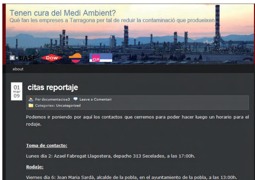
Figura 2. Blog del documental “¿Cuidamos el medio ambiente?” http://documentacioa3.wordpress.com

pezar a tejer el reportaje. Empieza el proceso de grabación según una planificación que los estudiantes conocen desde el primer día de curso.