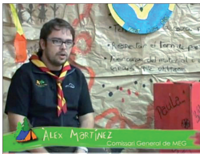
Figura 3. Imagen del documental “Escuela de vida. El escultismo en Catalunya”, http://www.youtube.com/watch?v=bGNLPRY4nCc

“ El blog motiva al aprendizaje y sirve de almacén de consulta al que acudir para planificar cada nuevo paso del reportaje ”