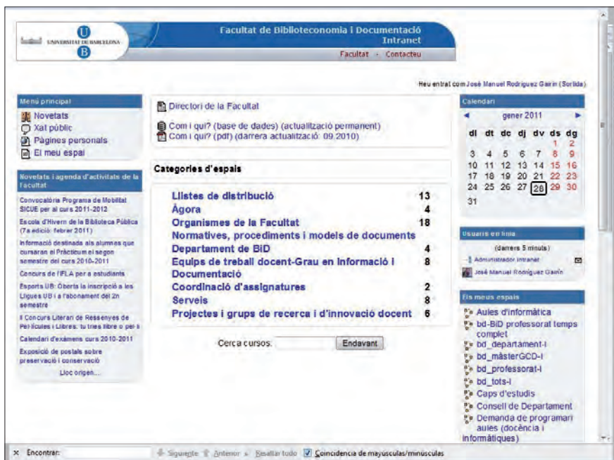
Página principal de la intranet de la Facultat de Biblioteconomia i Documentació

contenidos Drupal ha implementado módulos basados en el indexador Solr de Apache , opción adoptada por ejemplo en la web de las bibliotecas de la UPC ( Serrano-Muñoz , 2010). http://www.autonomy.com/ http://drupal.org/project/apachesolr http://bibliotecnica.upc.edu