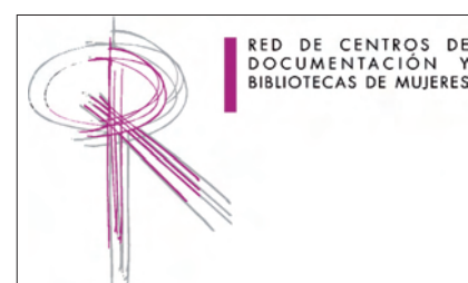
Figura 1. Logotipo de la Red de Centros de Documentación y Bibliotecas de Mujeres

– constitución de una red de centros que potenciara el apoyo profesional entre su personal, la más amplia cooperación bibliotecaria y la solución a los problemas comunes.