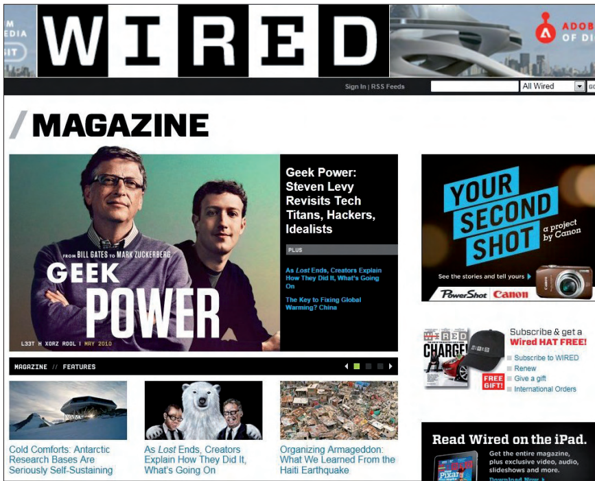
Figura 1. La palabra crowdsourcing ( crowd + outsourcing ) o participación de la gente en actividades (resolución conjunta de problemas, colaboraciones en medios de comunicación, etc.), la usó por primera vez Jeff Howe en la revista de divulgación científica Wired en 2006

para futuros temas y reportajes, y la función vigilante de la audiencia. Todas ellas requieren un cierto esfuerzo; jerarquizar las noticias posiblemente se encuentre en la base de la pirámide. Las escasas prácticas de crowdsourcing o periodismo de fuentes masivas a través de blogs realizadas hasta ahora han puesto de manifiesto el valor añadido de los usuarios en la cobertura de hechos especializados o de carácter social (Muthukumaraswamy, 2010; Bradshaw, 2007).