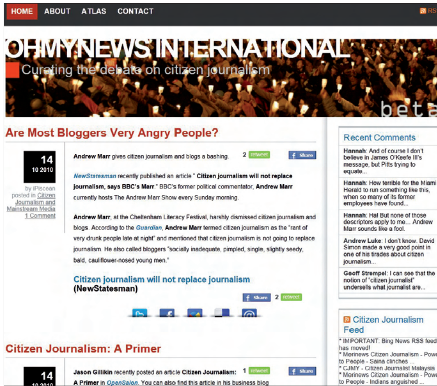
Figura 4. OhMyNews International se reconvierte en blog, ante la dificultad de gestionar con suficiente calidad la información ciudadana http://international.ohmynews.com/

a renovación metodológica como a la orientación de los estudios. Podemos mencionar contribuciones en los escenarios portugués (Zamith, 2008 y 2008a), francés (Jouet, 2009; Rebillard y Touboul, 2010), británico (Thurman, 2006; Thurman y Herbert, 2007; Thurman y Hermida, 2008, Singer y Ashman, 2009; Thurman y Hermida, 2010; Singer, 2010; Harrison, 2010), griego (Spyridou, 2008), alemán (Gerpott y Wanke, 2004), español (Domingo, 2008; García-De-Torres, 2006; García-De-Torres et al., 2008a; García-De-Torres et al., 2009a; Meso-Ayerdi y Palomo, 2009; Martínez-Martínez, 2009; Noguera, 2010, Díaz-Noci et al., 2010), de los Países Bajos (Paulussen y Ugille, 2008; De-Kayser y Raemecker, 2008; Bäkker y Merwi, 2009) y Eslovenia (Oblak, 2005; Kovacic y Erjavec, 2008). Existe una notable tradición de estudios comparativos, con el antecedente de Fortunati et al. (2005); Deuze, Bruns y Neuberger (2007), Paulussen, Heinonen, Domingo y Quandt (2007), Domingo et al. (2008), Örnebring (2008) y Vujnovic et al. (2010).