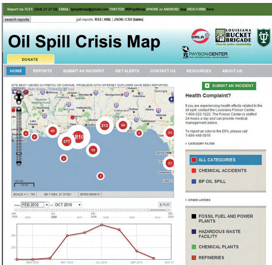
Figura 3. Ciudadanos periodistas organizados por la Louisiana Bucket Brigade ayudaron a hacer este blog - mapa sobre el vertido de petróleo en el Golfo de México http://oilspill.labucketbrigade.org/

En América Latina, Rost ha contribuido a desarrollar el concepto de interactividad y ha seguido la evolución de la participación en los medios argentinos – Rost y Pagni-Reta (2005), Rost (2006, 2007, 2008 y 2010) y Rost, Pagni-Reta y Apesteguía (2008), así como García (2007) e Igarza (2009 y 2009a)–. Podemos mencionar asimismo, los estudios sobre interactividad en los medios mexicanos de Caballero (1998, 2000), Navarro (2003, 2004, 2009), López-Aguirre (2009) y Lerma-Noriega (2009). En Perú –donde es pionera Rosa Zeta-De-Pozo (2002)– encontramos referencias a la participación en los trabajos de Lyudmyla