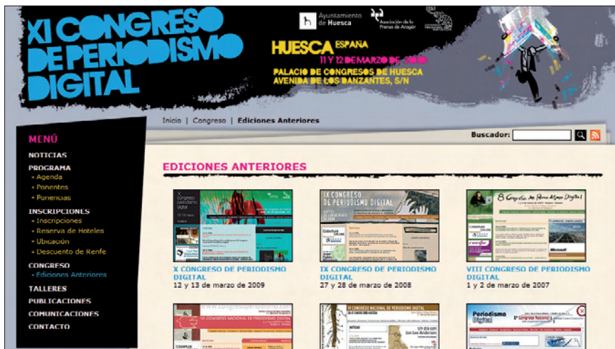
Web del XI Congreso de periodismo digital

combinación de aportaciones profesionales con otras académicas, ofreciendo un foro de debate común para que unos y otros intercambien visiones del periodismo digital. Sin lugar a dudas, ha sido durante años un referente en España.