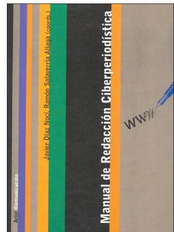
Manual de redacción ciberperiodística, de Díaz-Noci y Salaverría (coords.)

Entre ambos títulos, se publica uno de los clásicos del ciberperiodismo en España: Manual de redacción ciberperiodística ( Díaz-Noci; Salaverría , 2003). En esta obra los coordinadores trazan un mapa didáctico del periodismo digital con las aportaciones de casi una veintena de autores. El trabajo, además de su indudable interés académico, permitió la configuración de una de las redes de investigación sobre ciberperiodismo más fructíferas, constituida originalmente por profesores de las universidades de Santiago de Compostela , Navarra y el País Vasco .