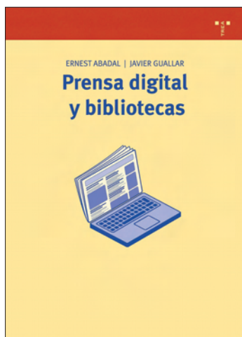
Prensa digital y bibliotecas, de Abadal y Guallar

ció a internet (2001). Antes, Lluís Codina había escrito El llibre digital. Una exploració sobre la informació electrònica i el futur de l'edició (1996) que, aunque no es un trabajo sobre periodismo digital, aborda por primera vez en España de forma sistemática conceptos cruciales de la especialidad, como el hipertexto. La obra