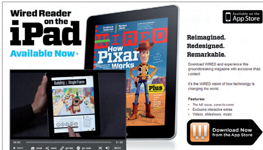
Versión de Wired para iPad, http://www.wired.com/magazine/ipad

ejemplo en forma de vídeo, de momento hay “algunas certezas y muchas dudas”. Según el estudio de Masip, el lenguaje de los vídeos informativos está más cerca en los cibermedios del entretenimiento que de la información. Piezas muy cortas, de 40 segundos, con un lenguaje sencillo y dinámico.