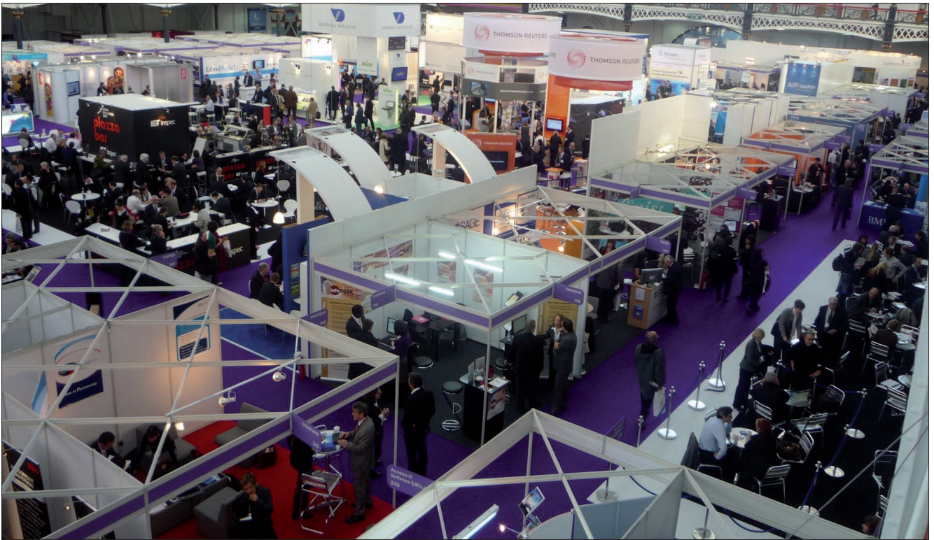
Vista parcial de la feria de la Online Conference. Las zonas oscuras, que ahora son zona de cafetería, eran ocupadas antaño por stands.

a las revistas científicas españolas ( Arce ), el repositorio Recolecta , y el proyecto Curriculum Vitae Normalizado (CVN) ;