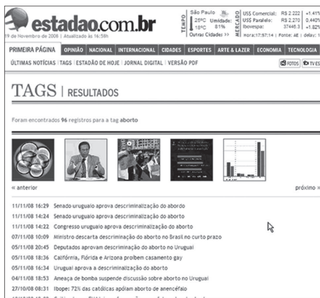
Figura 1. Recuperación de la memoria por medio de etiquetas

En la figura 2 tenemos un ejemplo más sofisticado, extraído de la edición online del New York Times (EUA) (19/11/2008) en el cual una noticia sobre la pérdida de influencia político-electoral del sur norteamericano