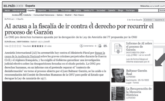
Figura 3. El recurso A Fondo , de El país , produce recuperación automática de memoria

En la figura 3, un ejemplo extraído de El País (España) (19/11/2008) muestra una amplia complementación/contextualización por la adición de memoria obtenida gracias al recurso A Fondo , que asocia noticias corrientes a material de archivo del periódico.