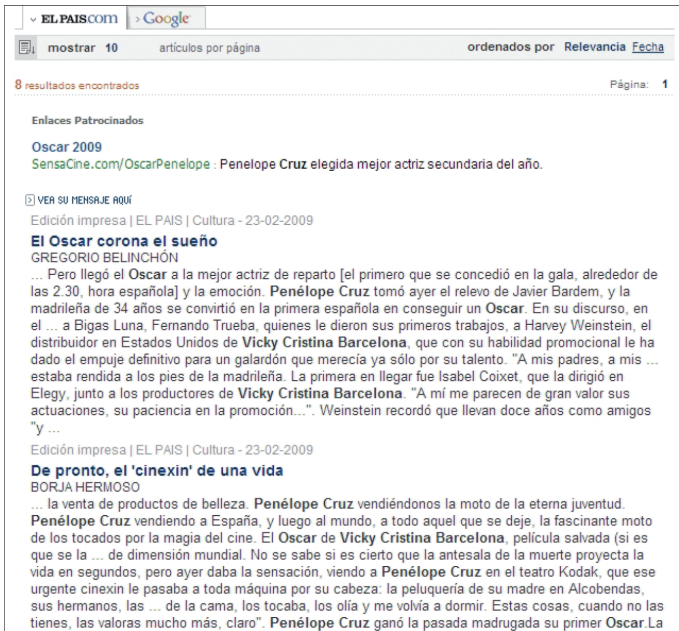
Figura 6. Pantalla de resultados de la búsqueda "Penélope Cruz", "Oscar", "Vicky Cristina Barcelona" en El país.com, en la que se puede apreciar la identificación de los términos de la consulta.

Se considera que cumple satisfactoriamente este indicador cuando el diario presenta documentos relacionados con la noticia recuperada, tanto de la fuente propia como de fuentes externas, y que lo cumple sólo parcialmente cuando muestra documentos relacionados del propio medio.