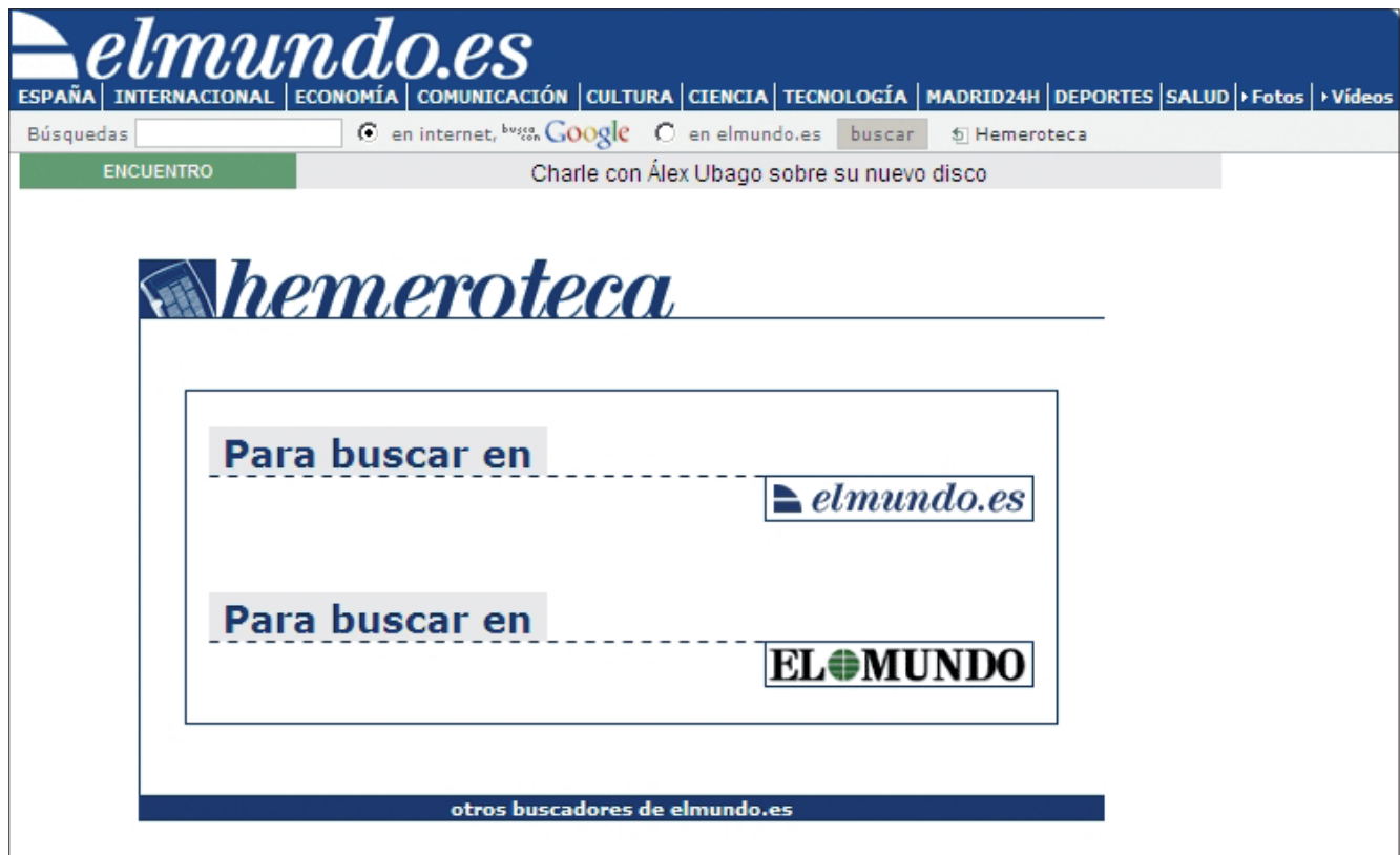
Figura 2. Colecciones digital e impresa en El mundo.es