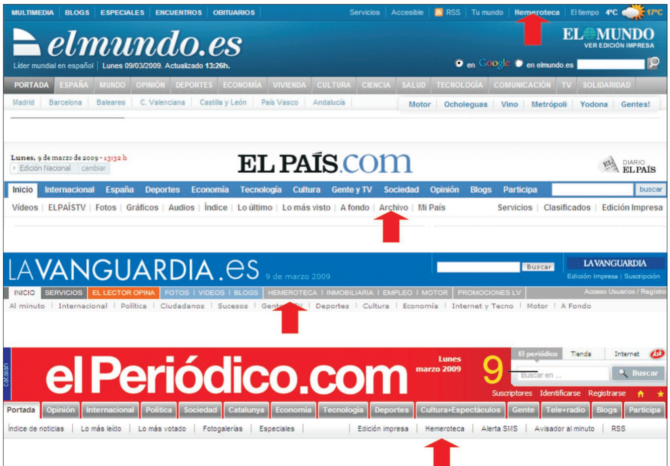
Figura 1. Ubicación del acceso al servicio de hemeroteca o archivo en la página de inicio de El mundo.es , El país.com , La vanguardia.es y El periódico.com

dos niveles de menús laterales poco visibles ( Sport.es ), o en primer nivel del menú lateral ( ABC.es ).