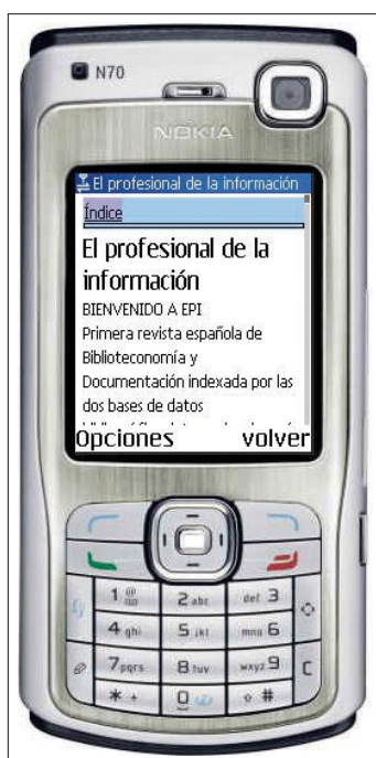
El profesional de la información

La existencia de una gran variedad de aparatos en el mercado puede llevarnos a cuestionarnos para qué tipo optimizar nuestro sitio web. Sin duda al-