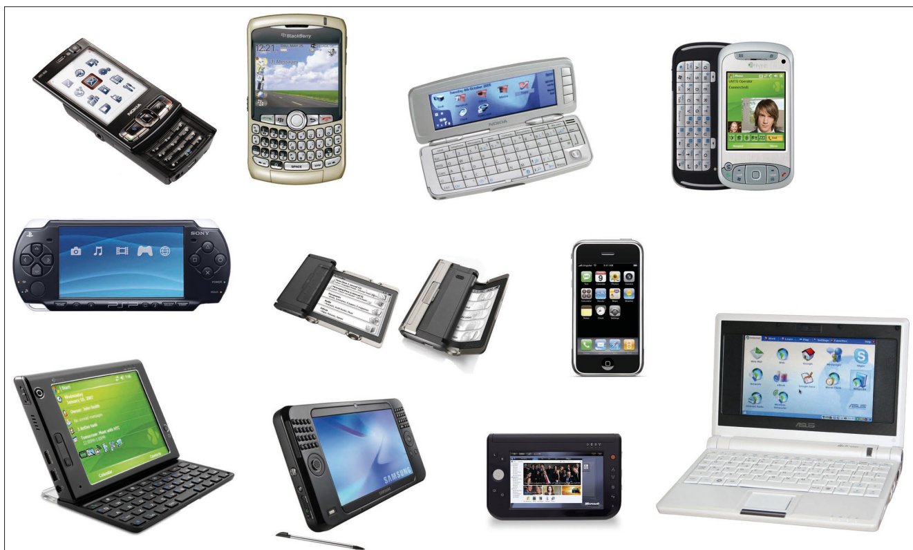
Diferentes tipos de dispositivos móviles

El lanzamiento del lector-e Kindle de Amazon ha abierto las posibilidades de mercado para un nuevo tipo de dispositivo, el libro electrónico, cuya finalidad última es la lectura de textos. Aunque son varios los que disponen de conexión vía wifi, como el iRex Iliad de Philips , FLEPIa de Fujitsu , el Kindle de Amazon o Readius ( Monteoliva; Pérez-Ortiz; Repiso, 2008 ), su única finalidad suele ser la descarga de libros, la consulta de determinadas páginas o la actualización de noticias mediante RSS, y no la navegación, aunque no cabe descartar que ésta sea una de las opciones que se hagan realidad en el futuro, en la línea marcada por el pionero Readius , el teléfono lector de documentos desplegable.