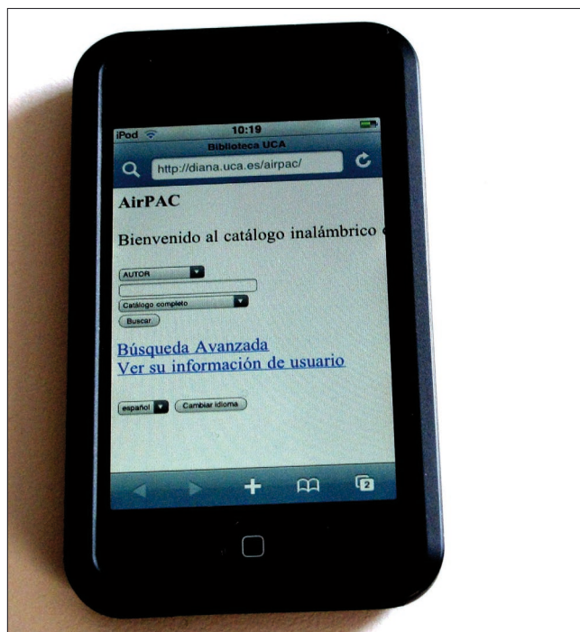
Catálogo AirPAC de la Universidad de Cádiz

http://biblioteca.uca.es/diana/Airpac.asp