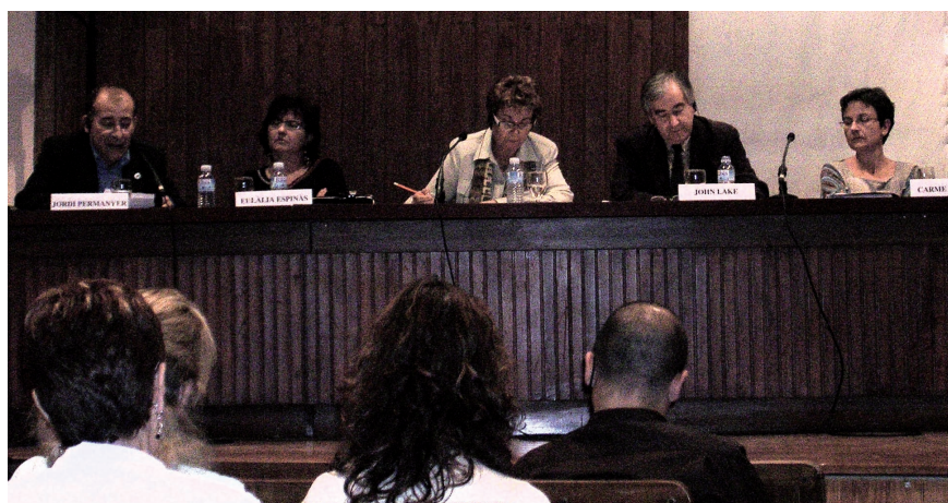
Un momento del seminario