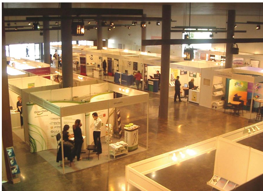
Aspecto de Documat