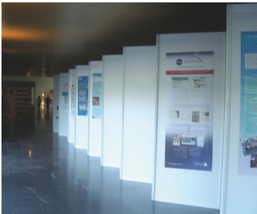
Espacio de posters en Fesabid 2007