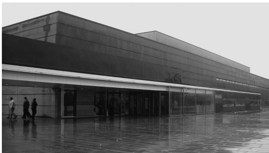
Palacio de Congresos de Santiago