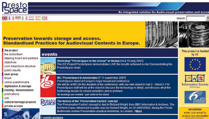
Figura 4. Prestospace

augura su nuevo edificio en Hilversum, pone en línea sus colecciones y lleva a cabo experiencias pioneras de cara al público.