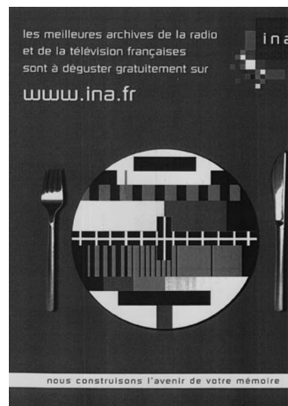
Figura 3. Promoción de los archivos de la radio y la televisión francesa, accesibles en la web del Ina

En abril de 2006, el Ina abre al gran público a través de internet el acceso a 100.000 grabaciones de radio y televisión, lo que supone más de 10.000 horas de material de archivo. El servicio obtiene un gran éxito entre el público en general y un gran eco en los medios de comunicación. La concepción de la sede web tiene un doble compromiso: por un lado incrementar el volumen de documentos y programas de archivo completamente accesibles, a través de una navegación ergonómica y con un potente motor de búsqueda; y, por otro lado, un compromiso editorial, revalorizando y convirtiendo el material de archivo en actual y contemporáneo.