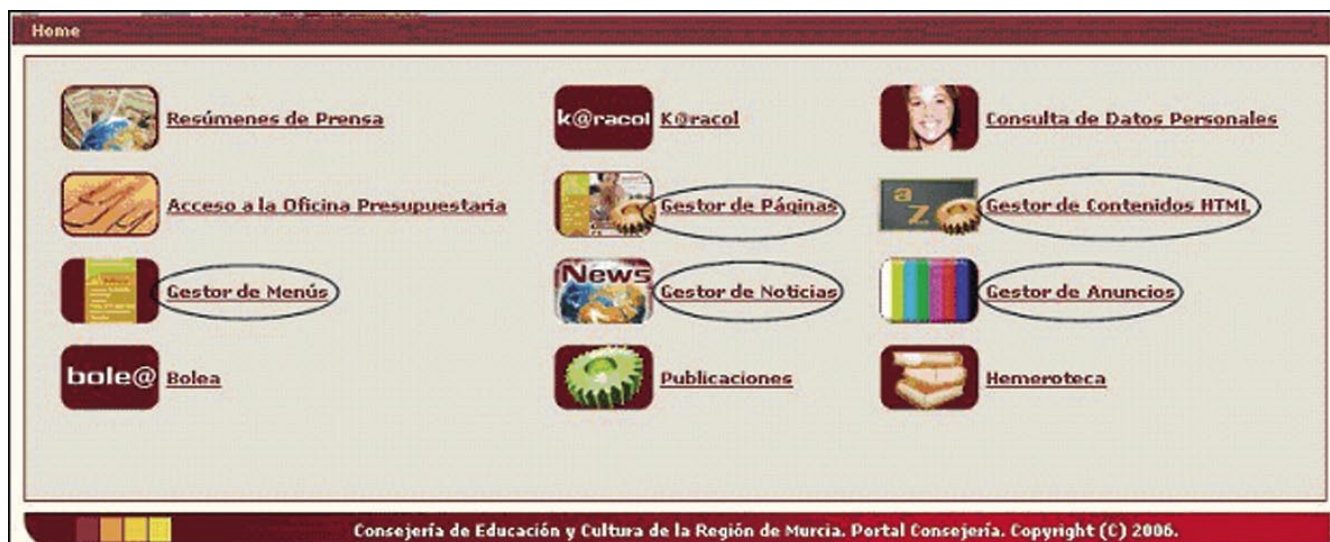
Figura 2. Gestores de contenido web