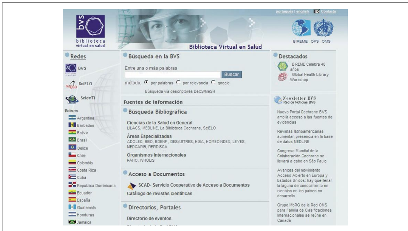
Portada actual del Bireme (captura parcial)