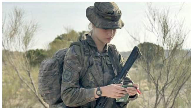
Imagen 1: Primeras maniobras militares (F4).

Posteriormente, el 7 de julio, la Princesa Leonor visitó por primera vez la Academia General Militar de Zaragoza, acompañada por los reyes y la ministra de defensa, antes de su ingreso oficial (F2) (Agencia EFE, 2023b). No fue hasta el 17 de agosto cuando comenzó oficialmente la formación militar de la princesa en Zaragoza (F3). La prensa resaltó los nervios propios de su nueva etapa, con titulares como “La Princesa Leonor inicia su formación militar con muchas ganas y un poco de nervios” (Europa Press, 2023). Su participación activa en ejercicios militares, incluyendo el manejo de un fusil durante las maniobras del 7 de septiembre (F4), también fue ampliamente cubierta por los medios, que destacaron la dualidad de su imagen como heredera del trono y su inmersión en un entorno tradicionalmente masculino (Vara, 2023) (Imagen 1).