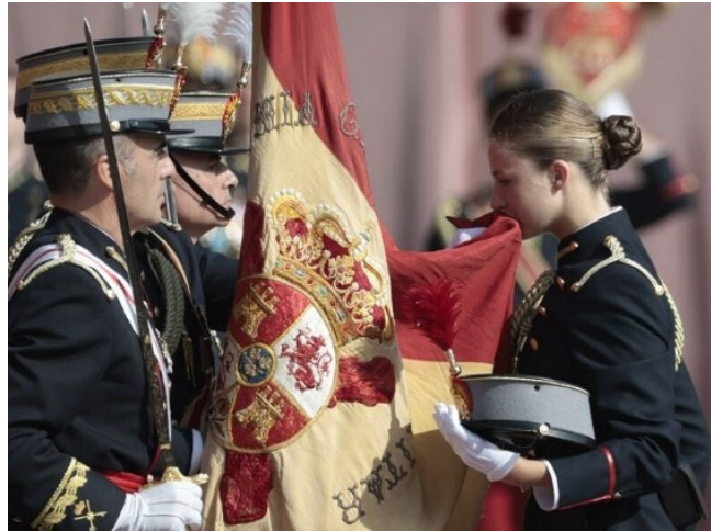
Imagen 2: Acto de Jura de Bandera (F6).

Unos días más tarde, el 19 de septiembre de 2023, la Princesa Leonor recibió el sable que la acredita como dama cadete en la Academia Militar de Zaragoza (F5), marcando un avance significativo en su formación castrense. Este evento, cubierto con titulares como “La princesa Leonor recibe el sable que la acredita como dama cadete en un acto cargado de simbolismo”, subraya su compromiso con los valores militares sin privilegios especiales, continuando su instrucción de cara a la jura de bandera prevista para octubre (Torrente, 2023). Como se muestra en la Imagen 2, el 7 de octubre, el juramento de bandera de la princesa en la Academia General Militar fue un momento clave que atrajo una gran atención mediática (F6), simbolizando su compromiso con las Fuerzas Armadas y su preparación para asumir mayores responsabilidades (Cruz, 2023).