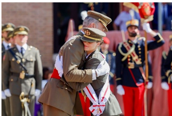
Imagen 3: Nombramiento dama alférez cadete (F10).

Días más tarde, el 17 de julio, la Princesa Leonor realizó su primera visita oficial en solitario al extranjero en Lisboa (S7). De la misma se destacó que se reforzaban los lazos históricos entre España y Portugal y se reafirmaba su compromiso con la herencia real. Es más, en este acto la Princesa Leonor fue condecorada con la Gran Cruz de la Orden de Cristo (RTVE, 2024).