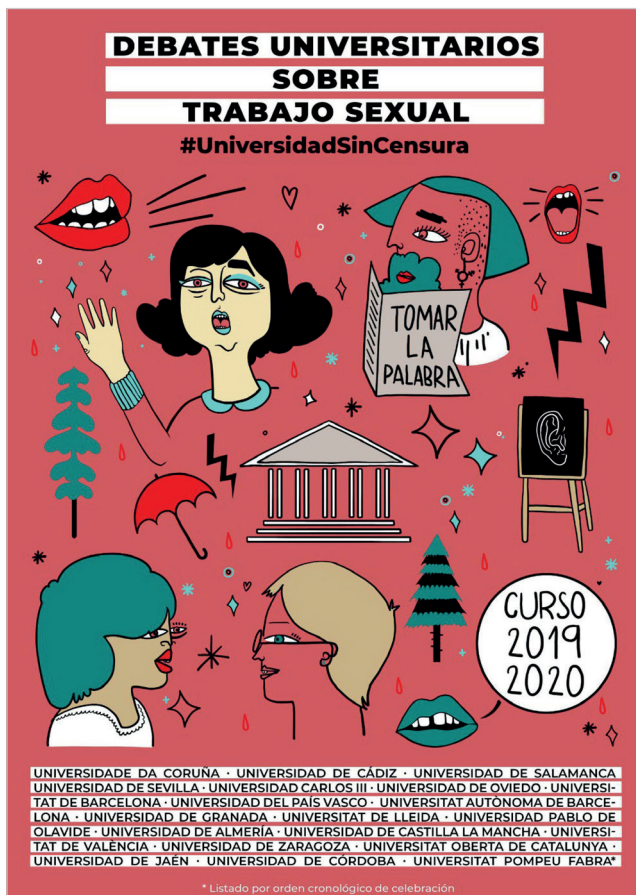
Figura 3. Cartel del programa “Debates universitarios sobre trabajo sexual”.