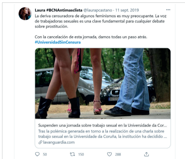
Figura 2. Ejemplo de argumento utilizado en la comunidad pro-debate. Fuente: Twitter .

Actualmente la red cuenta con una web en la que solo se recoge su conformación (43 profesores y profesoras de 25 universidades) y la forma de contacto. En los meses posteriores a la polémica, la presencia de la Raiapp apareció ligada a la participación de sus