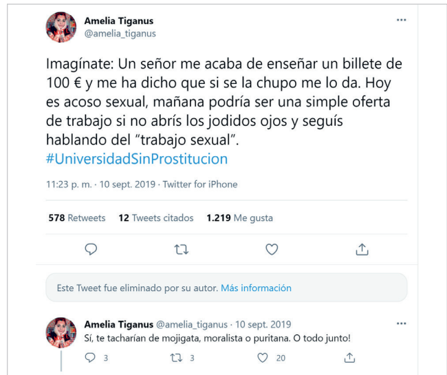
Figura 1. Uno de los tweets y respuestas de la cuenta con mayores valores de centralidad.

Las palabras más repetidas en el corpus señalan cómo el discurso que más circuló fue el abolicionista que apelaba a los afectos y las emociones, movilizand o la imaginación hacia una recreación de la corporalidad y la repugnancia para lograr desplazarla hacia el asco moral y el rechazo a la prostitución, siguiendo una lógica de pánico moral-sexual (Daich, 2013; Irvine, 2008; Rubin, 1989; Weeks, 2017) y procurando que la necesidad de prohibir la prostitución como un acto violento y vejatorio hacia las mujeres sirviese de argumento para no dar voz a las perspectivas que defienden el trabajo sexual. La figura 1 recoge uno de los tweets que más circuló para ilustrar el tono del argumento.