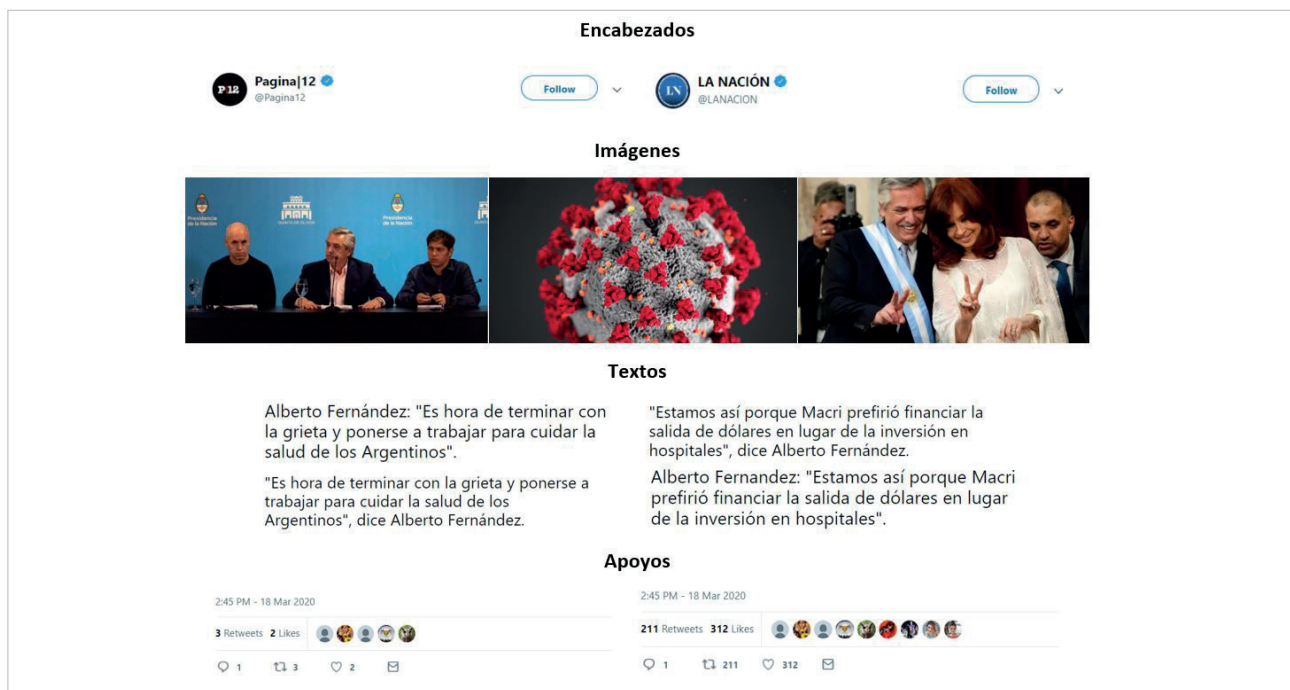
Figura 2. Elementos de encuadre en el experimento de tweets apareados ( conjoint experiment ).

Al “activar” determinadas publicaciones en los muros de nuestros amigos modificamos la frecuencia y la velocidad con la que esos contenidos circulan. Es decir que la activación de determinados mensajes por parte de los usuarios propaga frame elements que difieren en distintas regiones de la red