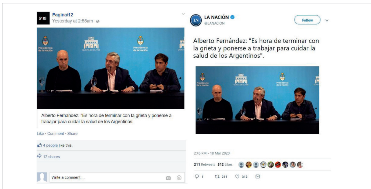
Figura 4. Facebook (izquierda) vs. Twitter (derecha), tal como se vería en el experimento.

Nota: Diferencias en la información si el experimento hubiese sido realizado en Facebook comparado con Twitter.