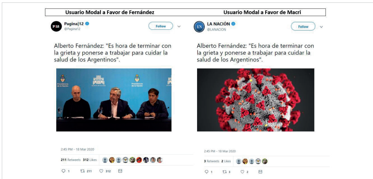
Figura 3. El tweet modal en la comunidad pro-Fernández (izquierda) y pro-Macri (derecha)

Más concretamente, dejan en evidencia que aquellos mensajes que resulten resonantes tendrán más probabilidad de ser aceptados y activados en cascada y, como consecuencia, cambiará su frecuencia de circulación en las comunidades virtuales habitadas por tales usuarios.