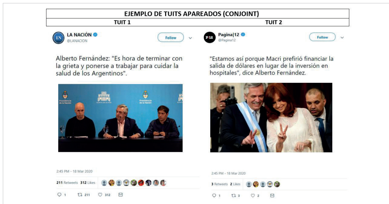
Figura 1. ¿Cuál de estos tweets es “menos probable que comparta en su muro”? Nota: Ejemplo de tweets apareados tal y como fueron presentados a los encuestados.

Las preguntas (1) y (2) dan cuenta del proceso de activación en cascada (Aruguete, 2019; Aruguete; Calvo, 2018), mientras que las preguntas (3) y (4) buscan medir los sesgos de atención selectiva 10 en el entorno del votante. En este artículo me enfocaré en la pregunta (2), dado que fuerza una respuesta de preferencia por uno de los dos tweets. Es decir, si un