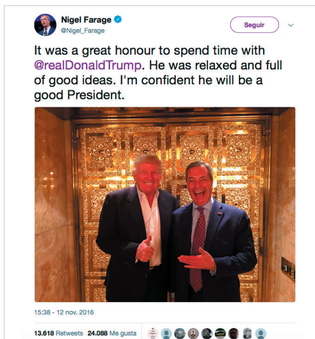
Imagen 2. Temas tratados por los líderes que resultan de mayor interés para el público