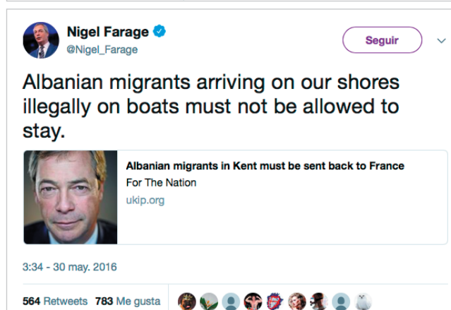
Imagen 1. Tweets sobre inmigración