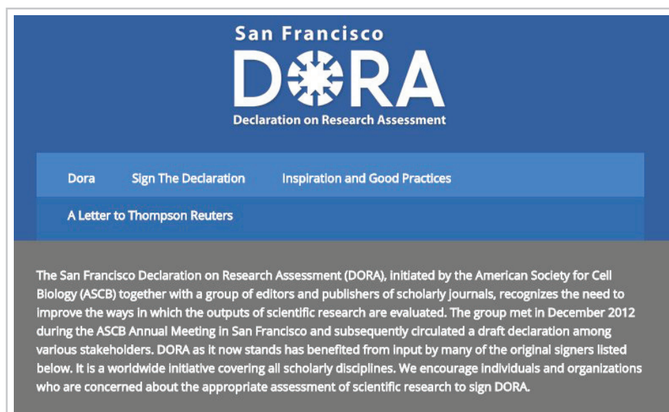
Figura 1. http://www.ascb.org/dora

Este artículo se inspira en una presentación realizada durante la conferencia ISSI2015 en Estambul que ahora se ha publicado en forma de artículo (Gorraiz; Gumpenberger, 2015), aunque no se trata de un resumen o una revisión de la misma, sino una contribución independiente.