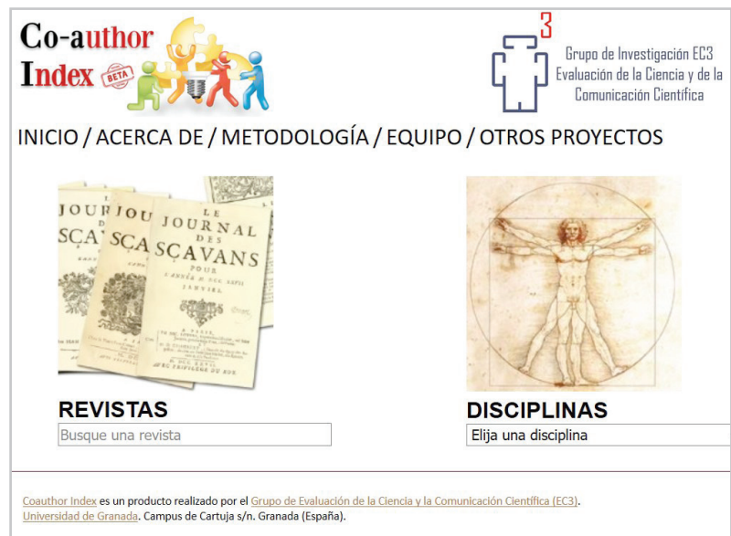
Figura 3. http://www.coauthorindex.info

Una forma neutral de presentar listas de valores en tablas es organizarlas por el identificador de los candidatos, pero