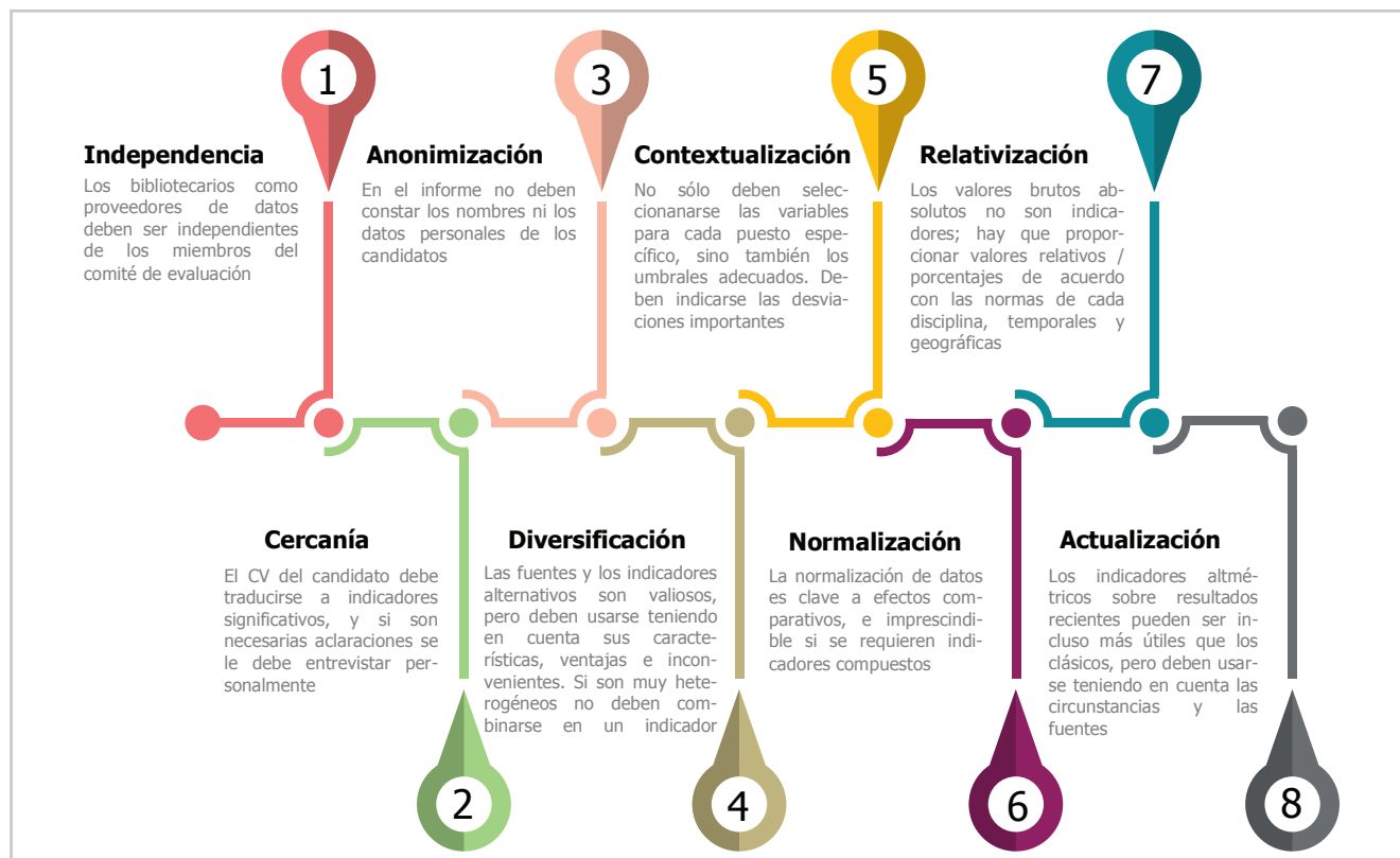
Figura 2. Modelo del protocolo descrito en el artículo

Dependiendo del tiempo y de los recursos disponibles, la selección de las fuentes debe ser lo más completa posible. Además de las bases de datos bibliométricas generales ( WoS , Scopus y Google Scholar ), también deben consultarse las especializadas (como PubMed , Chemical Abstracts , CiteSeer... ), y regionales ( Scielo , Dialnet ) para los concursos sobre temas específicos. Cuando las instrucciones de los evaluadores sean vagas o incompletas deben tenerse en cuenta la experiencia y los criterios de los bibliotecarios. Son fuentes pertinentes los motores de búsqueda generales ( Google , Bing ), pero también los regionales ( Baidu o Yandex ) sobre todo cuando no se pueden extraer de forma fiable las métricas de las redes sociales. Entre las fuentes “alternativas”, son útiles las redes académicas ( ResearchGate , Academia.edu , Mendeley ), blogs, microblogs ( Twitter ) y colecciones de archivos ( YouTube , Sli-deshare , GitHub ). En estos casos las herramientas de integración como ImpactStory , Altmetric o Plum Analytics son una alternativa práctica, pero hay que usarlas con mucho cuidado puesto que a menudo se trata de indicadores compuestos bastante opacos en su construcción.