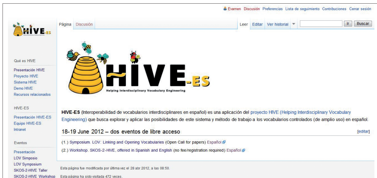
Figura 4. Wiki del proyecto HIVE-ES

La iniciativa HIVE-ES amplía la actividad inicial de HIVE para abordar estos retos en los países de habla hispana, que producen información y sistemas de organización del conocimiento en español. HIVE-ES permite la búsqueda y generación simultánea de metadatos orientados al contenido, extrayendo los términos de indización de múltiples vocabularios en español. Este proyecto se ha lanzado en España, en el seno del grupo de investigación Tecnodoc (Tecnologías Aplicadas a la Información y la Documentación) del Departamento de Biblioteconomía y Documentación de la Universidad Carlos III de Madrid , la Biblioteca Nacional de