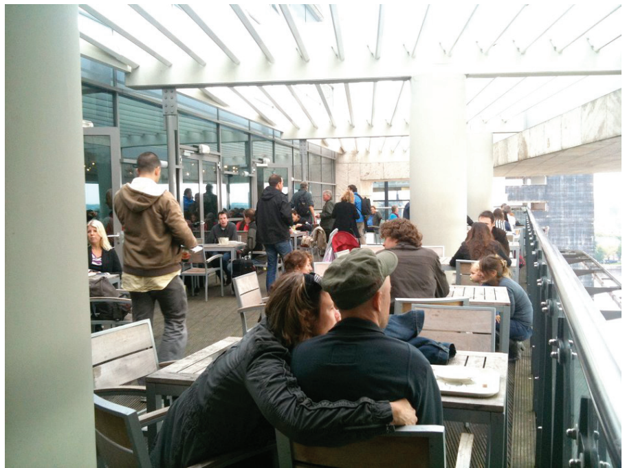
Figura 1. Menos espacio para libros y más para la gente (Biblioteca Pública de Amsterdam)

Entre finales del S. XX e inicios del siguiente se empieza a desarrollar la etapa de la biblioteca Digitalizada. Este período,