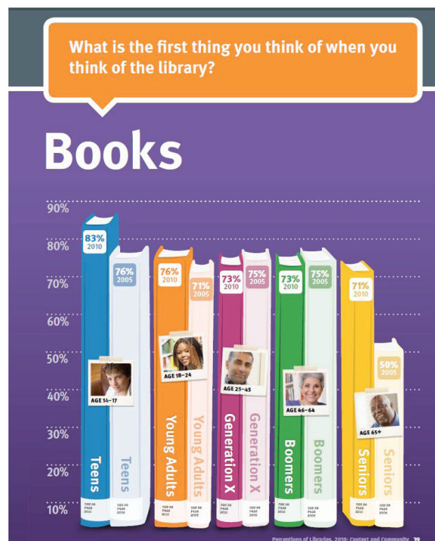
Figura 3. OCLC . Perceptions of libraries: context and community , p. 39. http://www.oclc.org/reports/2010perceptions/2010perceptions_all_singlepage.pdf

mejor dicho, su acceso, era escaso (y lo que abundaba era el tiempo del usuario para acceder a la información) ( Dempsey , 2012). El cambio del mundo digital no está en el soporte, sino en que la información fluye en la Red de forma casi libre. La información aparece al público como abundante, y las cosas abundantes tienden a ser consideradas de menor valor, menos importantes. Las bibliotecas pueden terminar siendo vistas como útiles sólo para preservar el pasado, es decir el libro impreso, y, consecuentemente, poco útiles para manejarse entre la información digital. En el entorno descrito algunos puntos fuertes de las bibliotecas se están debilitando.